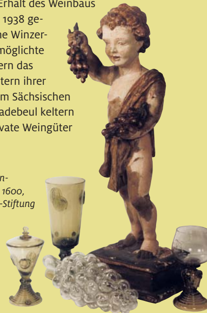
Christusknabe mit Weintrauben, spanisch, um 1600, Otto-und-Emma-Horn-Stiftung