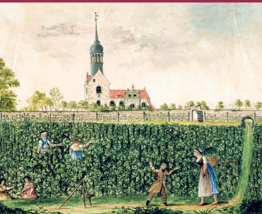
„Königlicher Weinberg bey Zscheyla“, um 1800, Aquarell (Stadtarchiv Meißen)