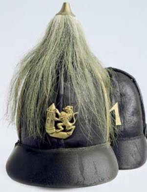
Helme der Freiwilligen Feuerwehr Meißen