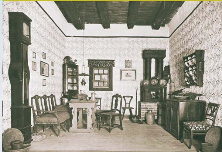
Winzerstube um 1800