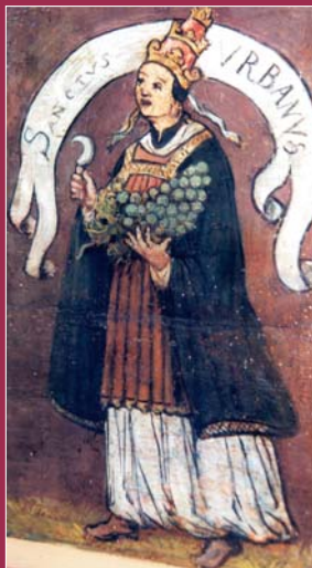
Hl. Bischof Urban, Schutzheiliger der Winzer, Ausschnitt aus dem Altarbild der Urbanskirche in Meißen/Cölln

Seit etwa 850 Jahren wird Wein aus dem Elbtal getrunken. Er hielt von Westen her Einzug und war zunächst gottestdienstlichen Zwecken vorbehalten. Die Urkunde aus dem Jahr 1161 belegt das Vorhandensein eines hiesigen Weinberges: Markgraf Otto der Reiche (1125-1190) übereignete der meißnisch-burggräflichen Kapelle St. Ägidius einen vermutlich im oberen Meisatal gelegen Weinberg. Bereits im Jahre 1356 erwarben auch die Meißner Stadtbürger über ihren Rat einen Weinberg – den heutigen Ratsweinberg. Von hier stammt die 1788 gebaute, deutschlandweit wohl größte, noch erhalten gebliebene per Handrad von fünf kräftigen Männern zu bedienende Zweispindelpresse, die im Stadtmuseum zu bewundern ist. In ertragreichen Jahren wurden darin 35 Faß, also ca. 14.000 l Wein gekeltert.