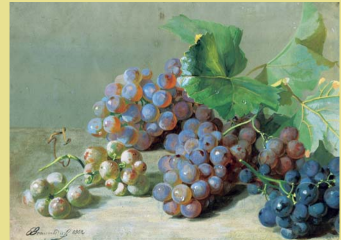
Weintrauben, 1862, Eduard Braunsdorf, Tempera (Stadtarchiv Meißen)

In Meißen soll es der Legende nach 365 Gaststätten gegeben haben. In einige können Sie zumindest bildlich Einblick nehmen und erfahren, wie kompliziert sich das Rechnen mit sächsischen Weinmaßen vor 1871 gestaltete: Bemessungsgrundlage war stets das „Fuder“ (die Fuhre). Es bestand aus zwei „Dresdner Faß“ zu je 404,15 l. Auch der „Eimer“ wurde zum Weinmaß. Er war der 6. Teil eines Fasses und enthielt 67,38 l. Ein Sächsischer Schoppen umfasste 0,24 l. Unser heutiger Schoppen enthält nur noch 0,2 l. Nach dieser mathematischen Anstrengung ist es unseren Besuchern überlassen, ein „Zehntel“ im Stadtmuseum zu verkosten. Sehr zum Wohle!