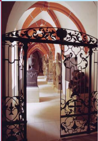
Kreuzgang im Stadtmuseum